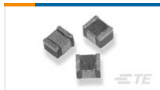
TE 产品编号9-1624112-2 3650 0603 0.27uH 5% 2K RL