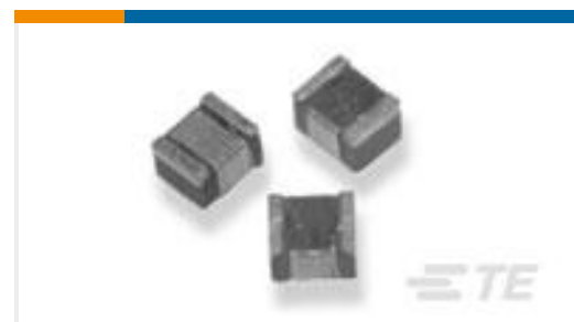
TE 产品编号1624112-5 3650 0603 33nH 5% 2K RL