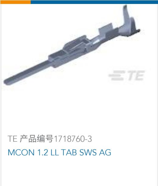
TE 产品编号1718760-3 MCON 1.2 LL TAB SWS AG