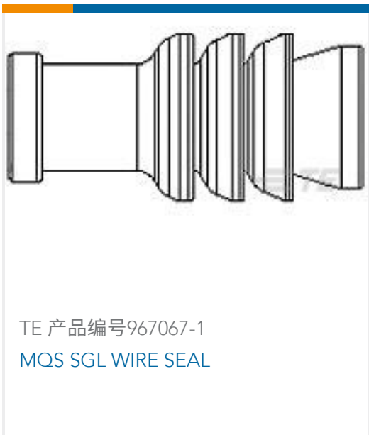
TE 产品编号967067-1 MOS SGL WIRE SEAL