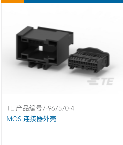
TE 产品编号7-967570-4 MOS 连接器外壳