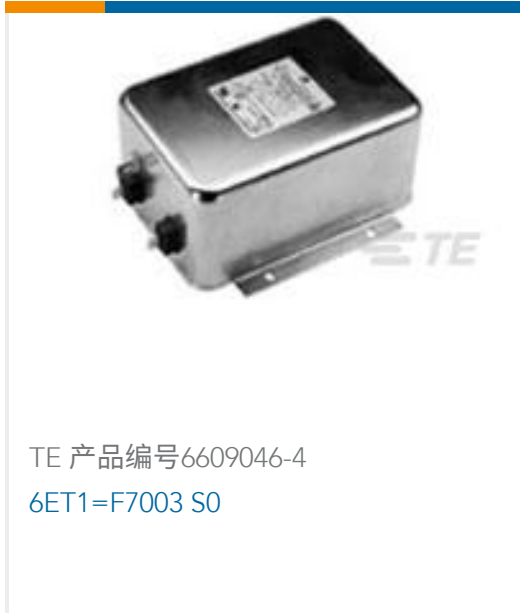
TE 产品编号6609046-4 6ET1=F7003 S0