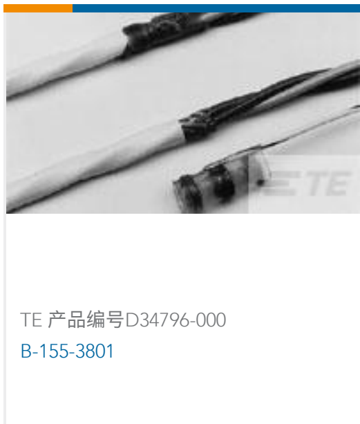
TE 产品编号D34796-000 B-155-3801