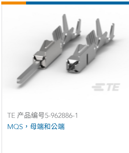
TE 产品编号5-962886-1 MOS, 母端和公端