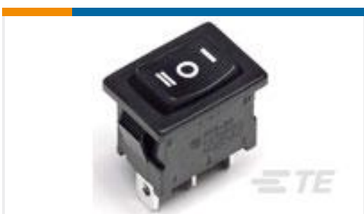
TE 产品编号1-1571076-0 PRASA1-16F-BB0BW=POWER ROCKER