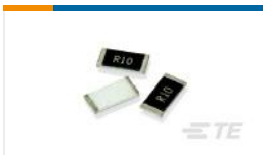
TE 产品编号1-1622824-8 RL73H 2B R91 1% 5K RL