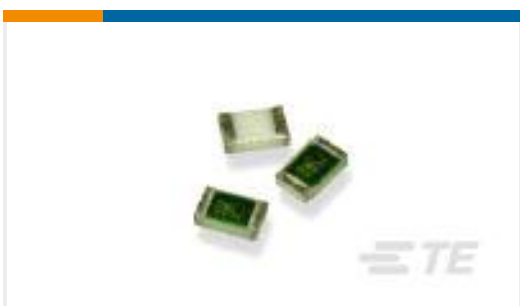
TE 产品编号8-1676481-1 CPF 0603 18K 0.1% 25PPM 1K RL