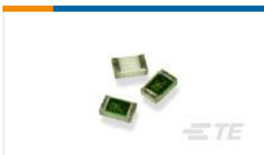
TE 产品编号9-1879208-2 CPF 0402 62K 0.1% 25PPM 1K RL