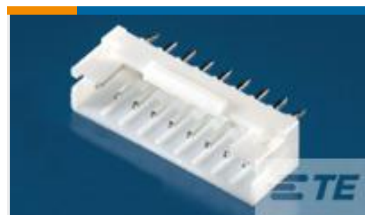
TE 产品编号1735446-8 2MM PITCH HPI POST HEADER, VERTICAL, 8P