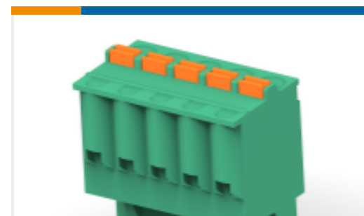
TE 产品编号2350397-5 5 POS SPRING TB PLUG, PITCH 5.00