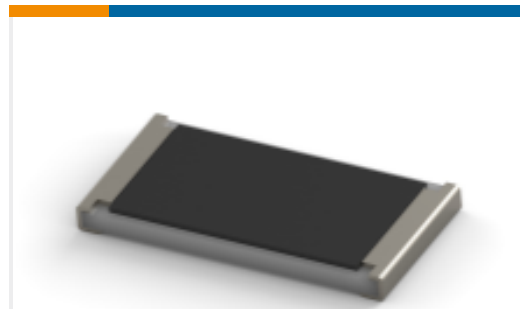
TE 产品编号1-2176070-4 SMD 功率电阻器：2 瓦特，3521 系列