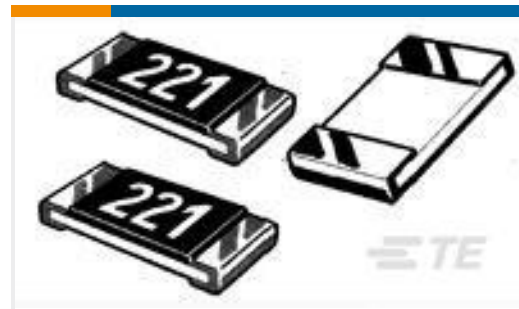
TE 产品编号7-2176231-2 3522 9K1 1% 3W