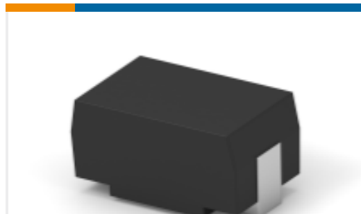
TE 产品编号2-1879234-3 SMD 功率电阻器：7 瓦特，200-2M 欧姆