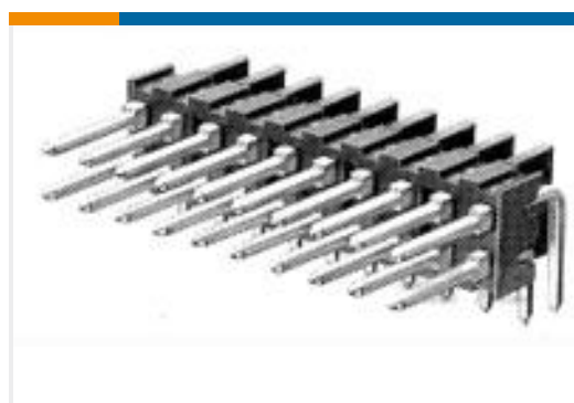
TE 产品编号1-86479-3 02 MODII HDR DRRA UNSHRD .100