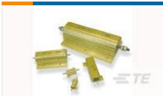
TE 产品编号1-1630019-2 HSC200 220R 5%