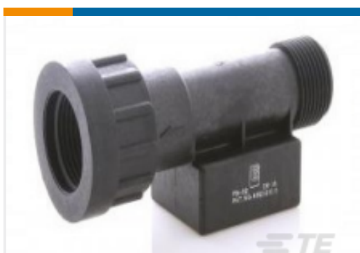
TE 产品编号CAT-FSS0002 3/4 英寸 BSP 外螺纹和内螺纹水流开关