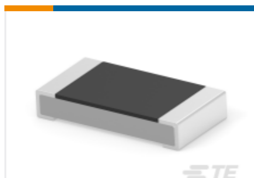
TE 产品编号1-2176392-1 RQ 1206 169K 0.1% 10PPM 5K RL