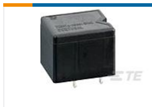
TE 产品编号1393277-8 V23076A1022C133