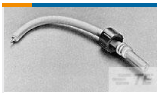
TE 产品编号1-830611-0 LGH 1/2 SNGL MLD END