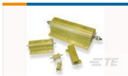
TE 产品编号9-1625971-5 HSA25 R01 10%