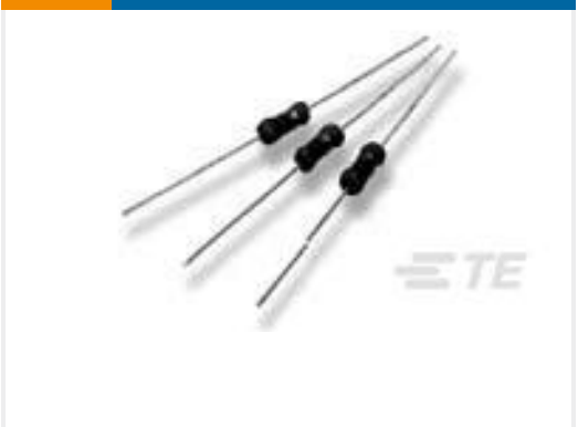
TE 产品编号1-1879353-9 RR02 5% 24K AMMO