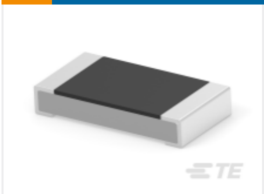
TE 产品编号2-2176392-9 RQ 1206 261K 0.1% 10PPM 5K RL