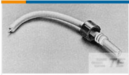
TE 产品编号1-830611-0 LGH 1/2 SNGL MLD END