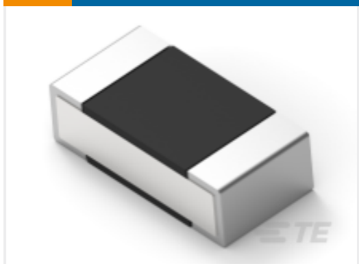
TE 产品编号7-2176305-3 RP 1E 0.1W 604R 0.1% 25PPM 5K RL