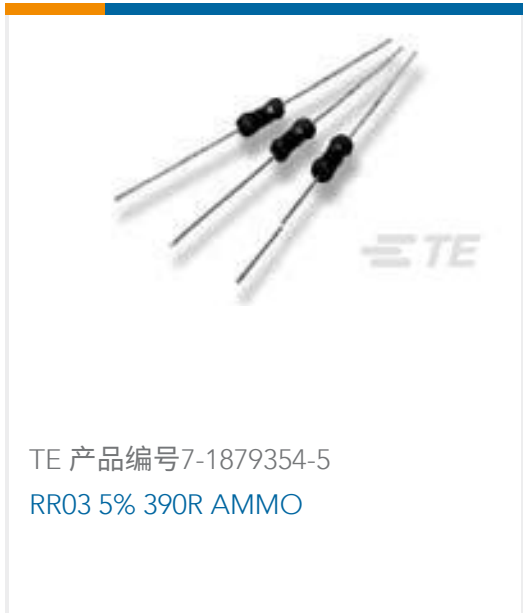
TE 产品编号7-1879354-5 RR03 5% 390R AMMO