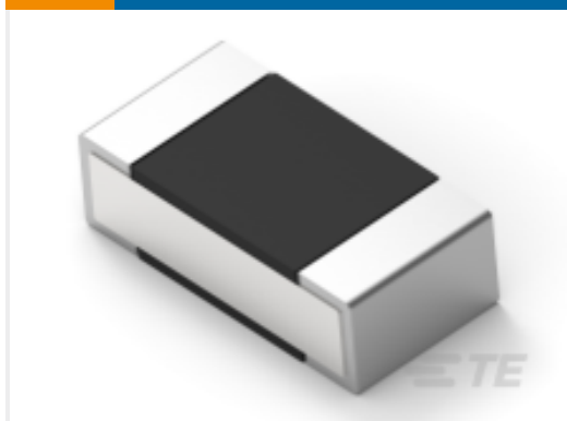
TE 产品编号3-2176307-2 RP 1E 0.1W 26K1 0.1% 25PPM 5K RL