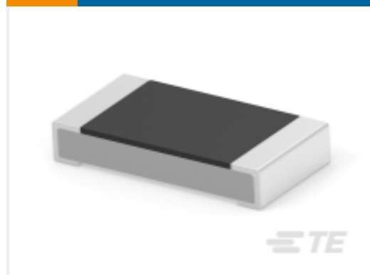
TE 产品编号2-2176392-9 RQ 1206 261K 0.1% 10PPM 5K RL