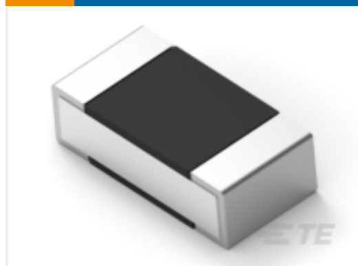
TE 产品编号7-2176305-3 RP 1E 0.1W 604R 0.1% 25PPM 5K RL