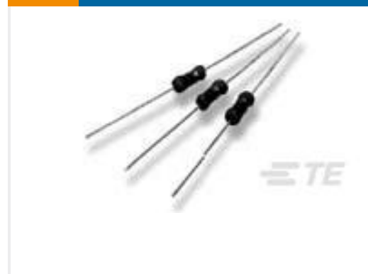
TE 产品编号1-1879353-9 RR02 5% 24K AMMO