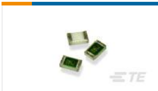
TE 产品编号5-1879215-8 CPF 0402 17K8 0.1% 25PPM 1K RL