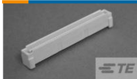
TE 产品编号3-5177986-4 0.8FH,P08H.5,100,08/Sn,TR,SC