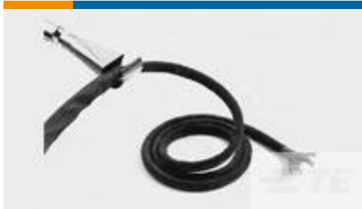
TE 产品编号CB7766-000 RW-200-1-0-SP