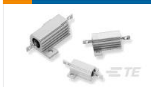
TE 产品编号5-1879071-2 THS50 1K0 5%