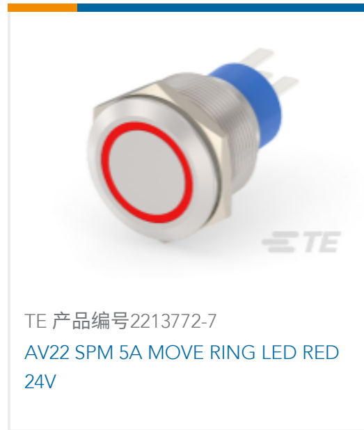
TE 产品编号2213772-7 AV22 SPM 5A MOVE RING LED RED 24V