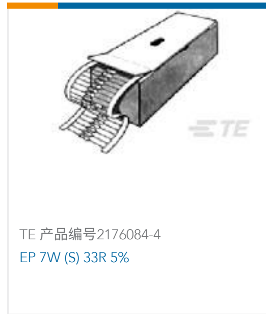
TE 产品编号2176084-4 EP 7W (S) 33R 5%