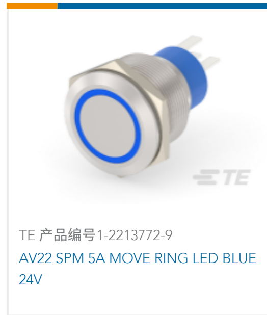
TE 产品编号1-2213772-9 AV22 SPM 5A MOVE RING LED BLUE 24V