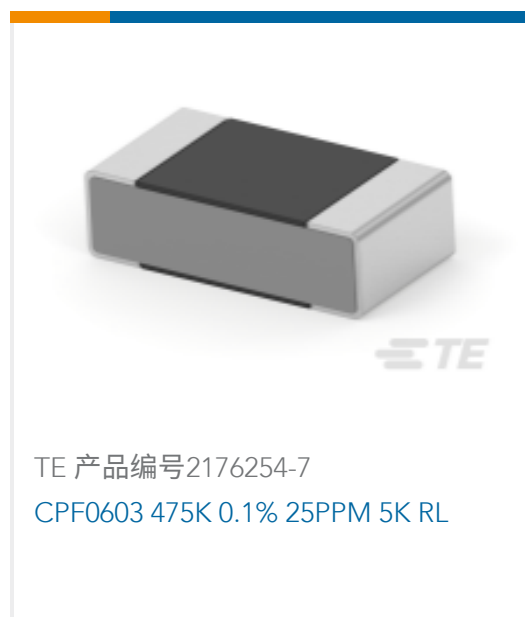
TE 产品编号2176254-7 CPF0603 475K 0.1% 25PPM 5K RL