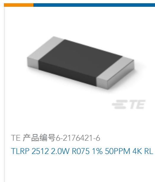
TE 产品编号6-2176421-6 TLRP 2512 2.0W R075 1% 50PPM 4K RL