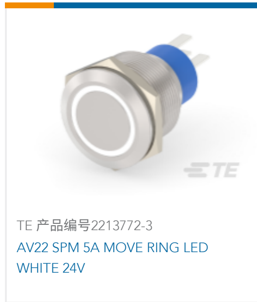
TE 产品编号2213772-3 AV22 SPM 5A MOVE RING LED WHITE 24V