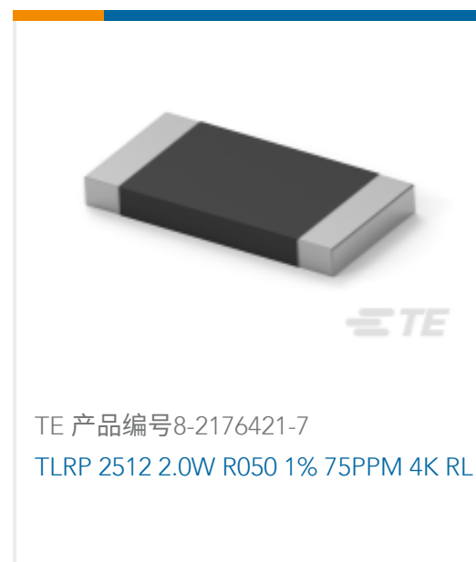
TE 产品编号8-2176421-7 TLRP 2512 2.0W R050 1% 75PPM 4K RL