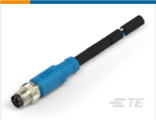
TE 产品编号T4061110004-001 M8 CABLE ST M 0.5M 4POS PVC CABLE