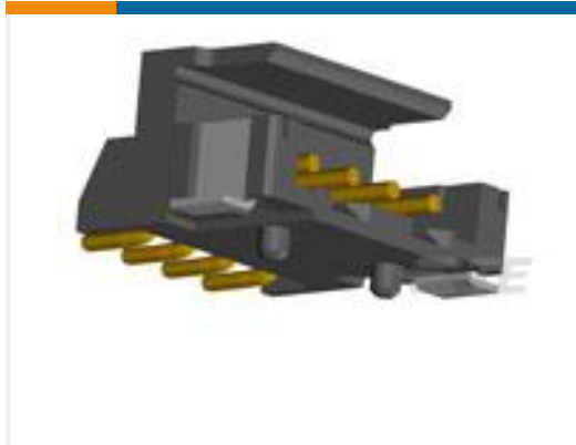
TE 产品编号2-292173-3 CT BOX HDR H SMT 3P O/TAPE BLA