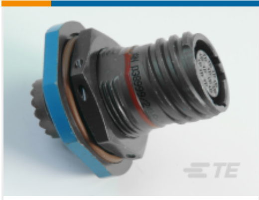
TE 产品编号YDTS24F09-98PNV001 RECP ASSY