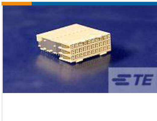
TE 产品编号6469081-1 HMZD 3PR, RECEPTACLE ASSEMBLY