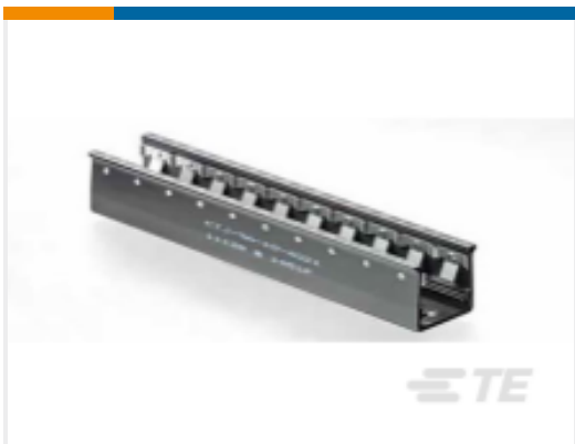
TE 产品编号CTJ-3A-02 RAIL ASSY