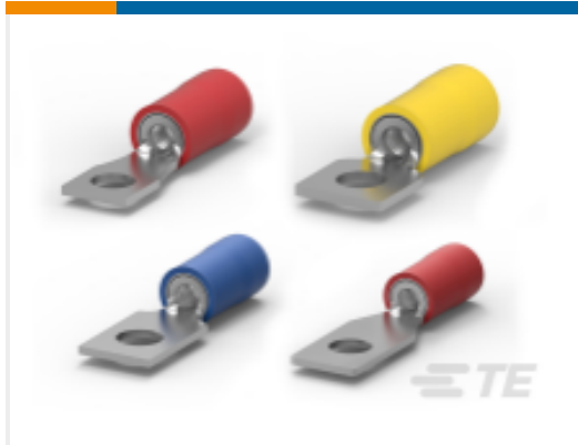
TE 产品编号2-327964-4 PIDG Rectangular Tongue Terminals