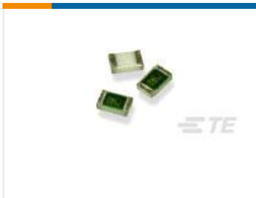
TE 产品编号2-1879213-8 CPF 0402 49R9 0.1% 25PPM 1K RL