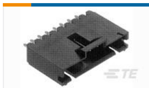
TE 产品编号5-103639-9 10 MTE HDR SRST LATCH .100CL