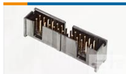
TE 产品编号2-1761603-8 IDC LOW PRO HDR 24P VERT BLUE