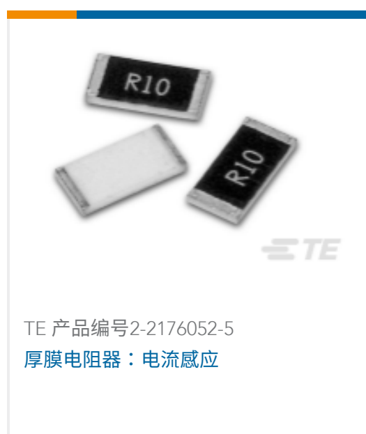
TE 产品编号2-2176052-5 厚膜电阻器：电流感应