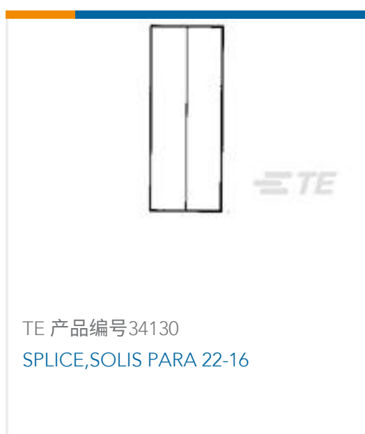
TE 产品编号34130 SPLICE,SOLIS PARA 22-16