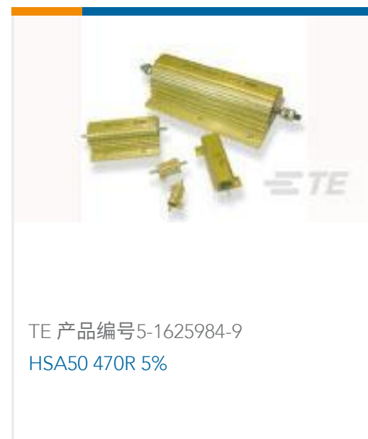
TE 产品编号5-1625984-9 HSA50 470R 5%