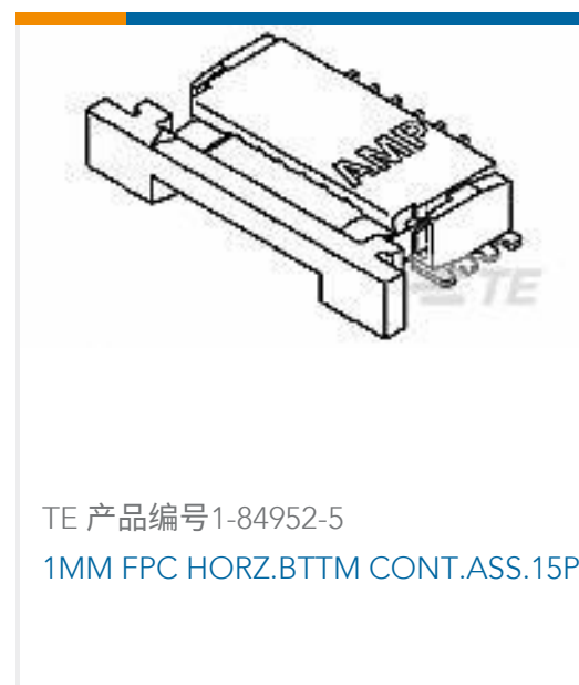
TE 产品编号1-84952-5 1MM FPC HORZ.BTTM CONT.ASS.15P