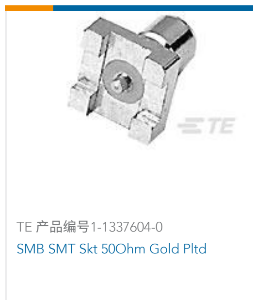
TE 产品编号1-1337604-0 SMB SMT Skt 50Ohm Gold Pltd