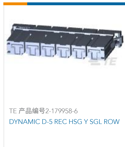
TE 产品编号2-179958-6 DYNAMIC D-5 REC HSG Y SGL ROW