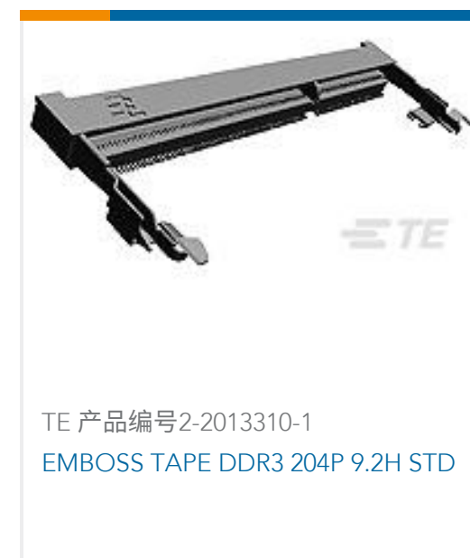
TE 产品编号2-2013310-1 EMBOSS TAPE DDR3 204P 9.2H STD