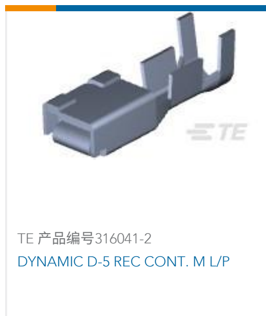
TE 产品编号316041-2 DYNAMIC D-5 REC CONT. M L/P