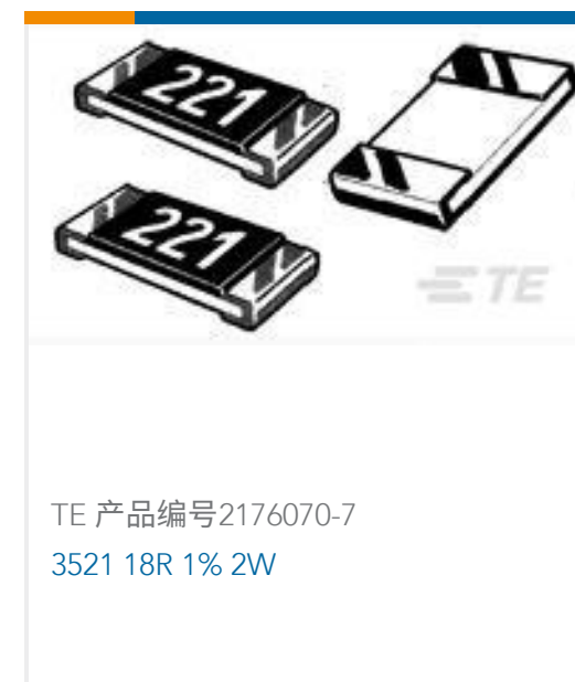
TE 产品编号2176070-7 3521 18R 1% 2W