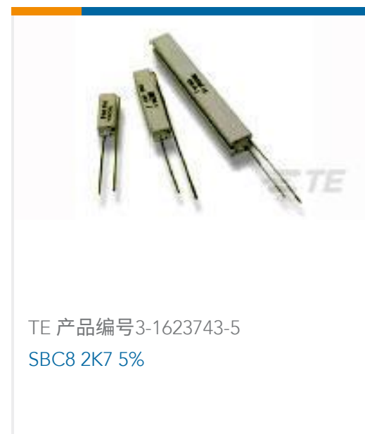
TE 产品编号3-1623743-5 SBC8 2K7 5%