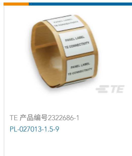
TE 产品编号2322686-1 PL-027013-1.5-9