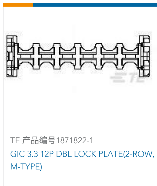
TE 产品编号1871822-1 GIC 3.3 12P DBL LOCK PLATE(2-ROW, M-TYPE)