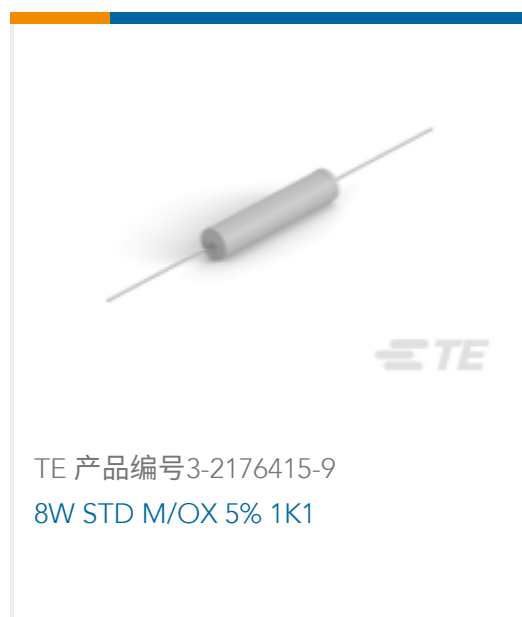
TE 产品编号3-2176415-9 8W STD M/OX 5% 1K1