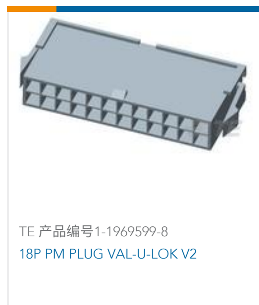
TE 产品编号1-1969599-8 18P PM PLUG VAL-U-LOK V2