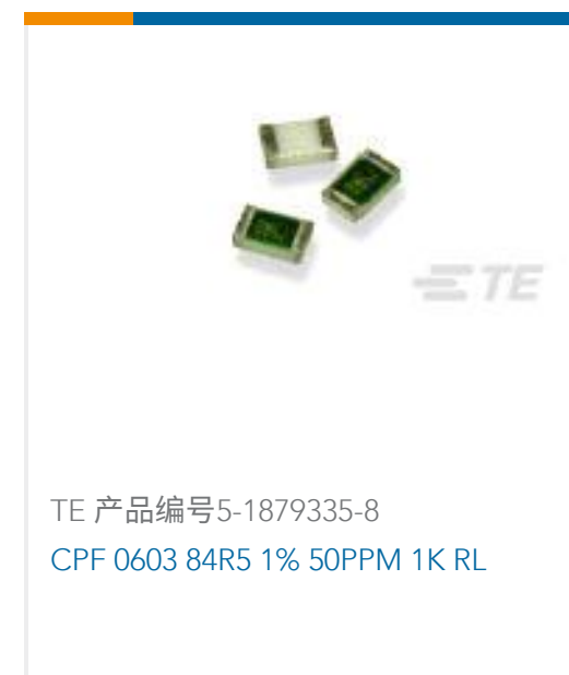
TE 产品编号5-1879335-8 CPF 0603 84R5 1% 50PPM 1K RL