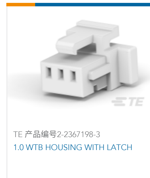
TE 产品编号2-2367198-3 1.0 WTB HOUSING WITH LATCH