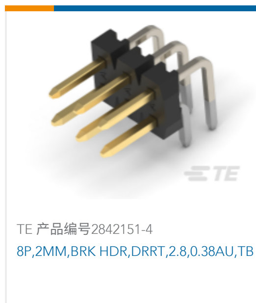
TE 产品编号2842151-4 8P,2MM,BRK HDR,DRRT,2.8,0.38AU,TB