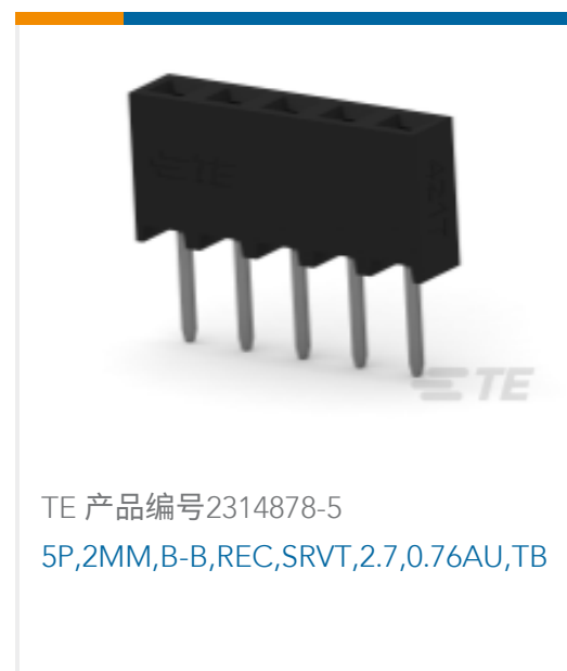
TE 产品编号2314878-5 5P,2MM,B-B,REC,SRVT,2.7,0.76AU,TB