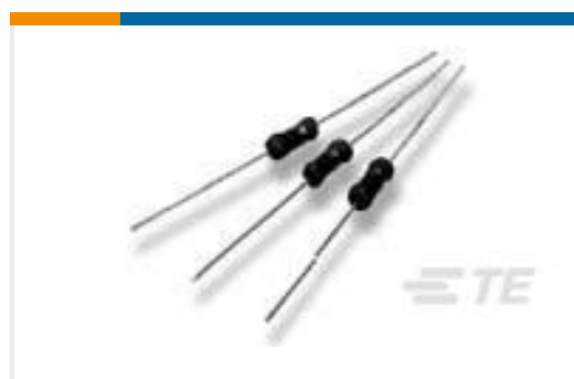
TE 产品编号1879353-4 RR02 5% 5K6 AMMO