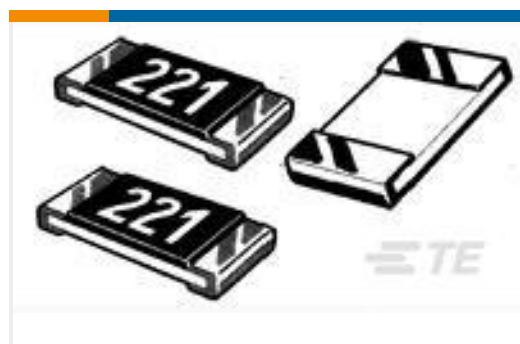
TE 产品编号2176070-2 3521 11R 1% 2W