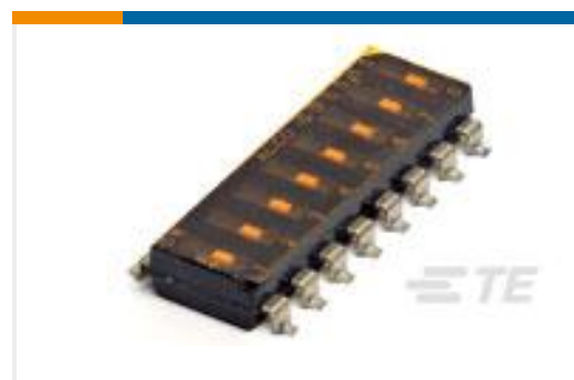
TE 产品编号1825006-3 GDS02S04=DIP SW,SLIDE,SMT