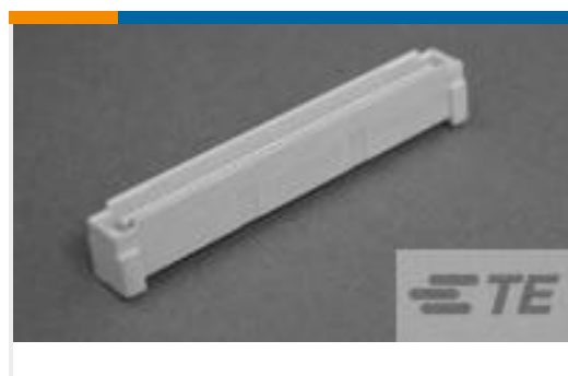
TE 产品编号5179031-3 0.8FH,P08H.5,080,08/Sn,TU