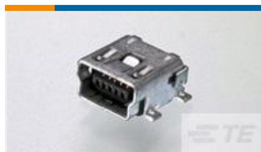
TE 产品编号1-1734035-2 MINI USB, TYPE B, R/A, SMT