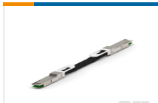
TE 产品编号2323767-4 DD-DD, 28AWG 2-8PR, 2.5M