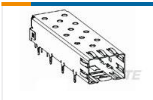
TE 产品编号2227302-1 CAGE ASSY, PRESS FIT, SFP