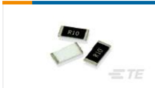
TE 产品编号2176052-9 RLP73N 1J R11 5% 5K RL