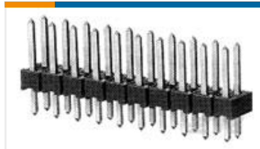
TE 产品编号7-146256-0 40 MODII HDR DRST B/A .100CL L