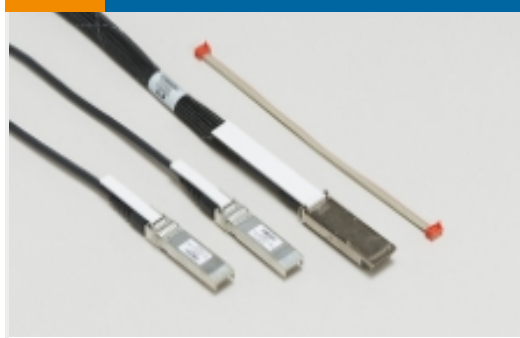
插拔式 I/O 电缆部件(81)