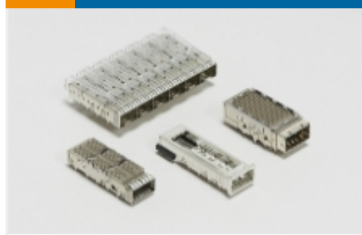
插拔式 IO 连接器和笼子(425)