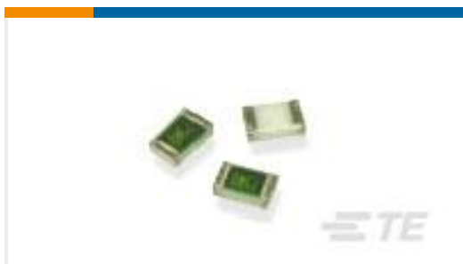
TE 产品编号5-2176093-4 RP 2A 0.25W 34K8 0.1% 25PPM 1K RL