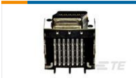
TE 产品编号1761482-1 MRJ21 48POS RCPT ASSY, W/O PAN