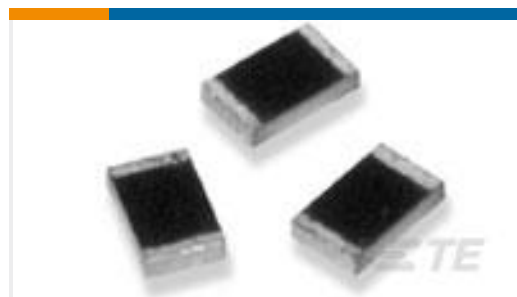
TE 产品编号7-1879276-3 RP 2A 10K 0.1% 15PPM CUT LENGTH