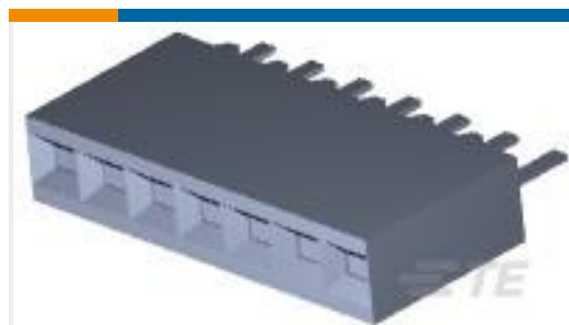
TE 产品编号534237-5 07 MODII VRT SR CE 100/115