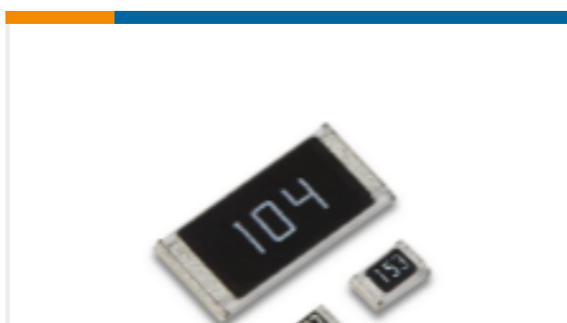
TE 产品编号2176349-8 CRGCO 2512 39R 1%