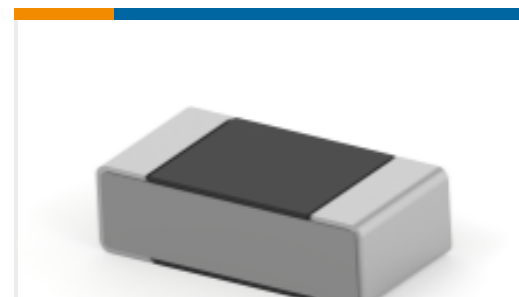
TE 产品编号2176236-1 CPF A 0402 49R9 0.1% 25PPM 5K RL