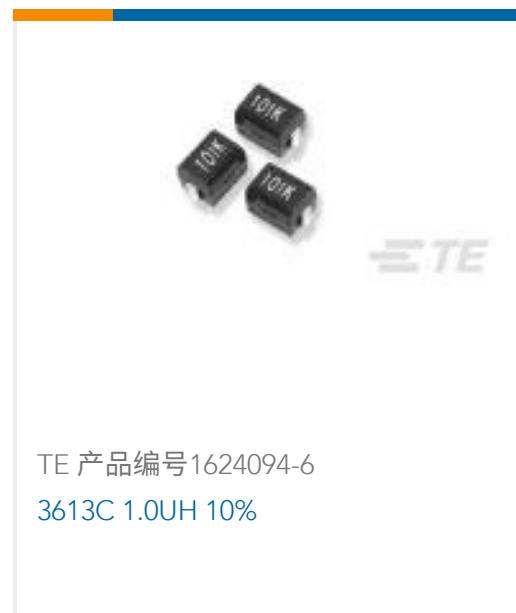
TE 产品编号1624094-6 3613C 1.0UH 10%