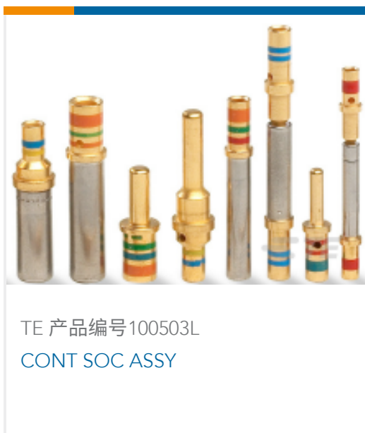
TE 产品编号100503L CONT SOC ASSY