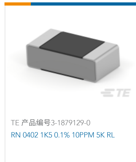
TE 产品编号3-1879129-0 RN 0402 1K5 0.1% 10PPM 5K RL