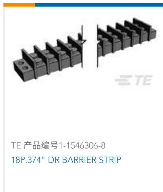
TE 产品编号1-1546306-8 18P.374" DR BARRIER STRIP