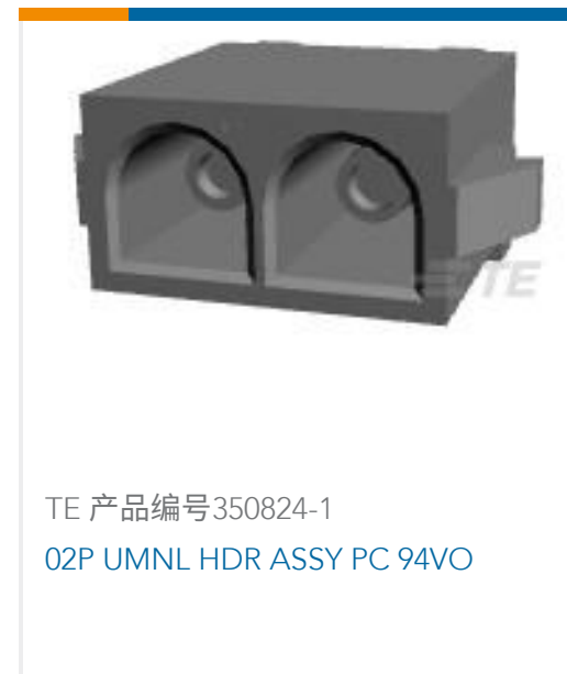
TE 产品编号350824-1 02P UMNL HDR ASSY PC 94VO