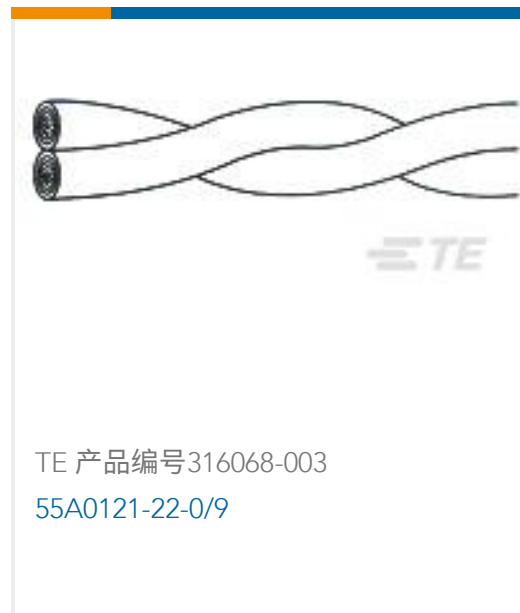
TE 产品编号316068-003 55A0121-22-0/9