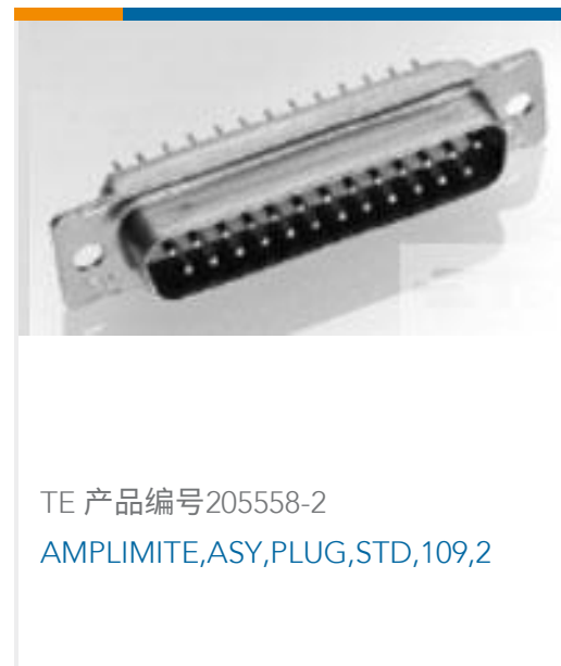
TE 产品编号205558-2 AMPLIMITE,ASY,PLUG,STD,109,2