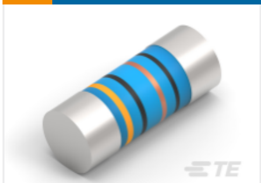
TE 产品编号2176314-4 MELF SMA_A 180R 0.1% 15PPM 0102 0.3W