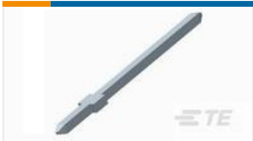
TE 产品编号1-928836-2 MOD2 PIN WITH A-PIN L/P