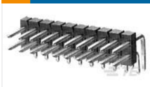
TE 产品编号826664-8 8P MOD2 STIFT LEI