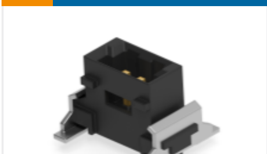
TE 产品编号284695-E SRCP 1,27 2 M 1 SMD 137 E1 094 * GU- H *