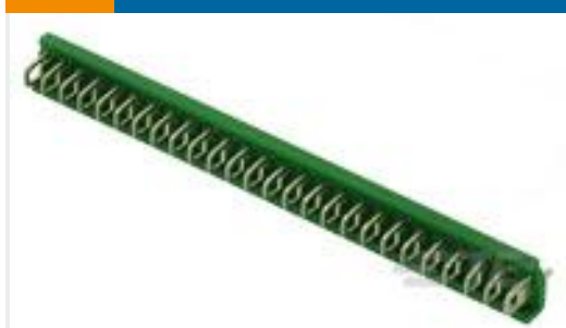
TE 产品编号1-5164713-1 11P.MINI-MATCH ASSY