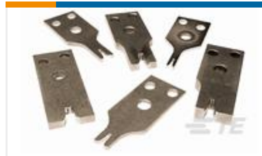
TE 产品编号6-456134-7 CRIMPER, INSULATION "F"(.210")