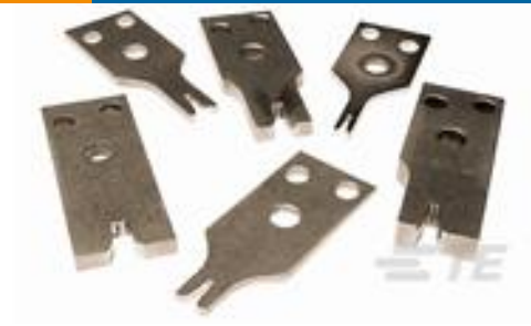
TE 产品编号6-1424909-6 CRIMPER, INSULATION "F"(.240")