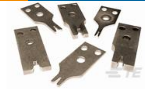
TE 产品编号6-456134-7 CRIMPER, INSULATION "F"(.210")