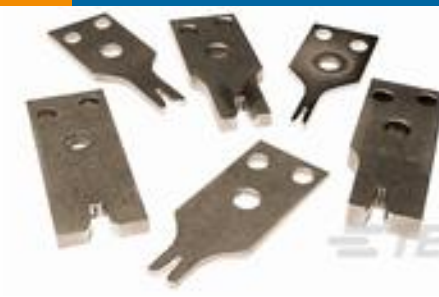
TE 产品编号6-456134-7 CRIMPER, INSULATION "F"(.210")