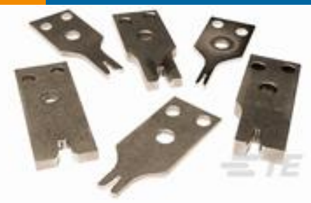
TE 产品编号6-1424909-6 CRIMPER, INSULATION "F"(.240")