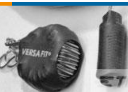
TE 产品编号CZ8200-000 VERSAFIT-3/4-0-2.25IN