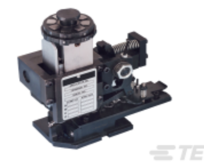
TE 产品编号680588-3 HDM 9HBAPR140S140OG