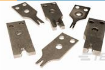
TE 产品编号6-456134-7 CRIMPER, INSULATION "F"(.210")