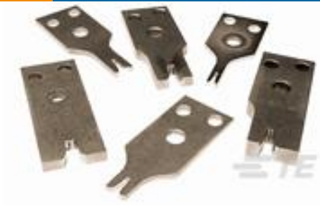
TE 产品编号6-456134-7 CRIMPER, INSULATION "F"(.210")