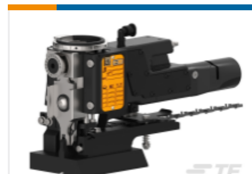
TE 产品编号2-2150296-2 OCEAN_2.0_Applicator-E-140F180F