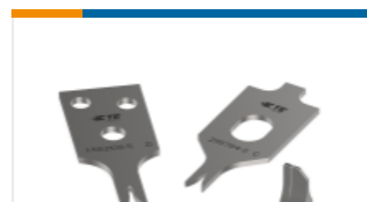
TE 产品编号7-2266867-7 OCEAN_2.0_SPARE_PART_KIT-054F057SP