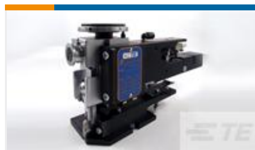
TE 产品编号2-2150053-2 OCEAN_2.0_Applicator-E-130F155OV