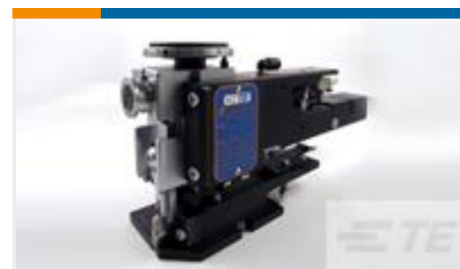
TE 产品编号2-2150223-2 OCEAN-2.0-APPLICATOR-E-180F250F