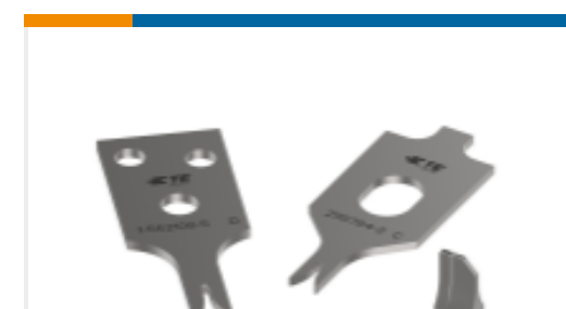
TE 产品编号7-2266896-7 OC-200F250F-CRIMPTOOLINGKIT