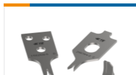
TE 产品编号7-2151243-7 OCEAN_2.0_SPARE_PART_KIT-070F0900