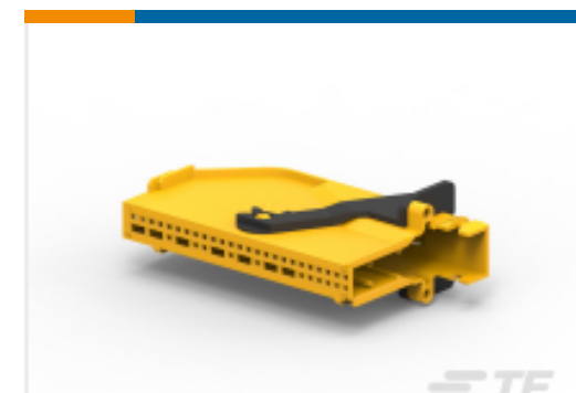
TE 产品编号3-1743109-3 AIR BAG 50P COVER ASSY M-YEL/LW