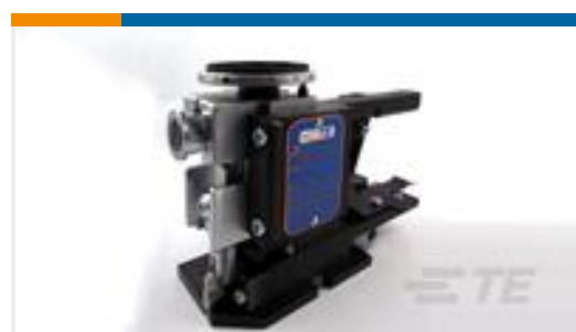
TE 产品编号2-2150202-1 OCEAN_2.0_Applicator-E-110F140OV