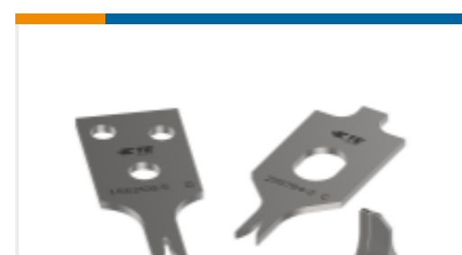
TE 产品编号7-2266896-7 OC-200F250F-CRIMPTOOLINGKIT