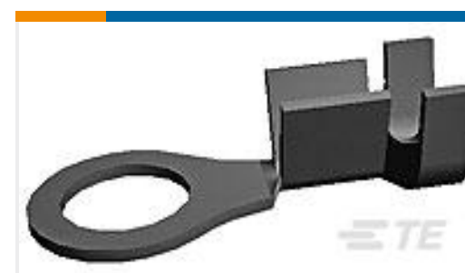
TE 产品编号140731-3 TERMINAL RING TONGUE 22 16