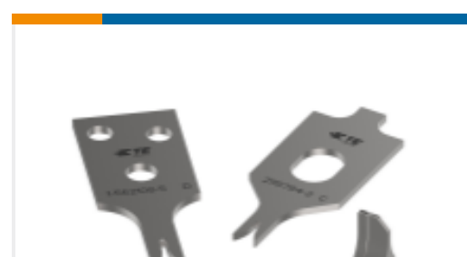
TE 产品编号7-2266867-7 OCEAN_2.0_SPARE_PART_KIT-054F057SP