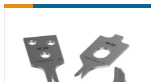
TE 产品编号7-2151243-7 OCEAN_2.0_SPARE_PART_KIT-070F0900