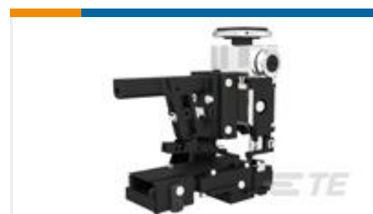
TE 产品编号2-2151145-1 OCEAN_2.0_APPLICATOR-S-155F180OV