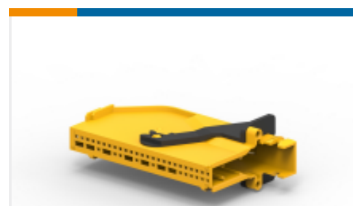
TE 产品编号3-1743109-3 AIR BAG 50P COVER ASSY M-YEL/LW