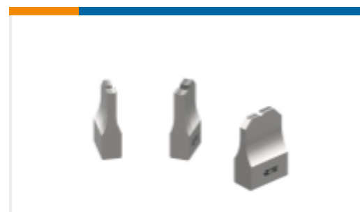
TE 产品编号4-1803057-8 ANVIL, COMBINATION