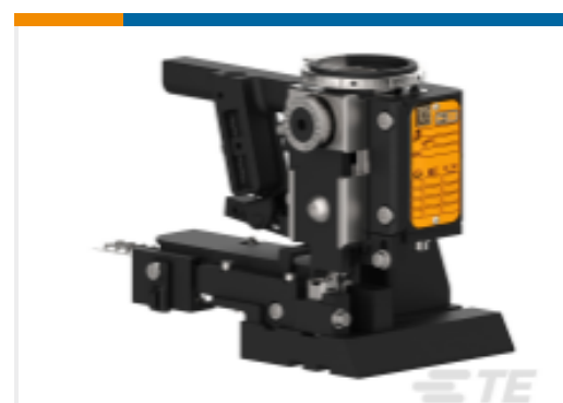
TE 产品编号2-2266877-1 OC-PA-S-FM-080F110F-059-1104