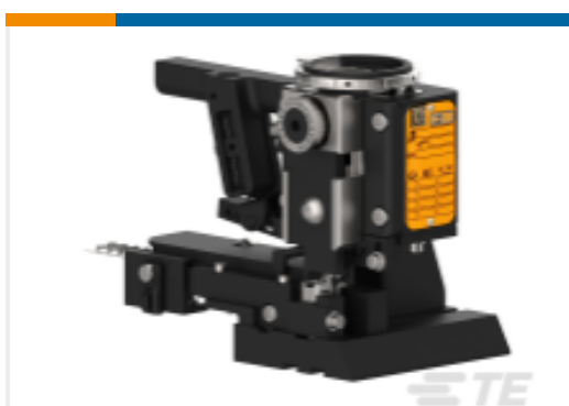
TE 产品编号2-2151414-1 OCEAN_2.0_APPLICATOR-S-096F1700