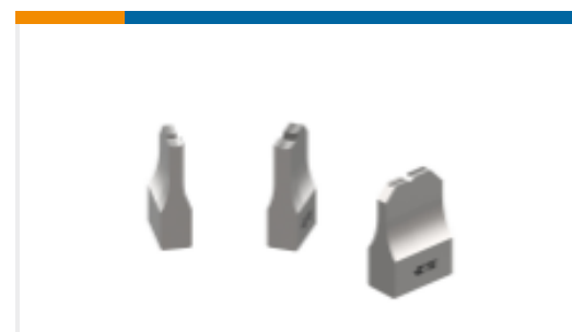
TE 产品编号4-1633917-4 ANVIL, COMBINATION