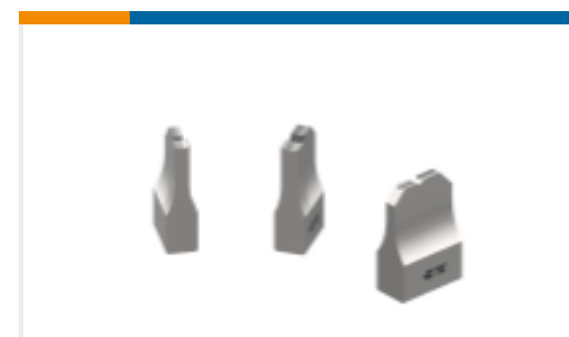
TE 产品编号6-1803171-3 ANVIL