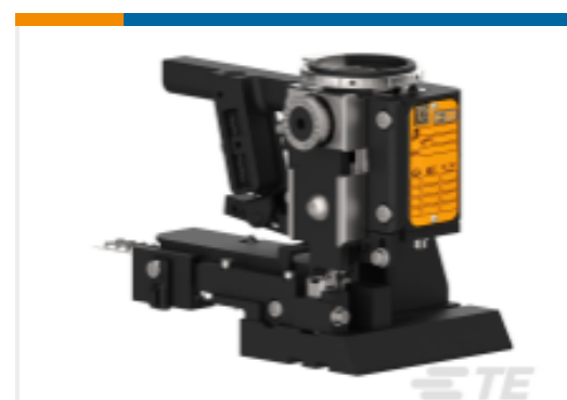
TE 产品编号2-2266750-1 OCEAN_2.0_Applicator-S-050F070F