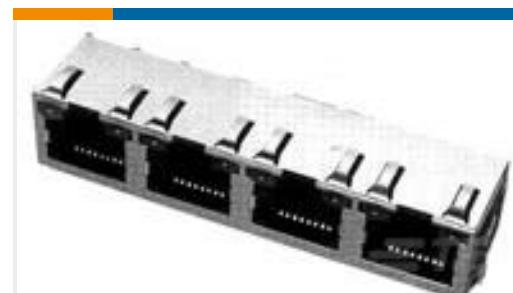
TE 产品编号5406544-1 INV MJ,1X4,PNL GRD