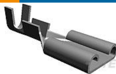
TE 产品编号63648-1 250 FASTON FLAG REC 20-14 AWG BR