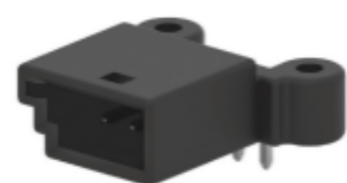
TE 产品编号1534531-1 Signal Header