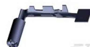
TE 产品编号1612124-3 1DIA SOCKET AU