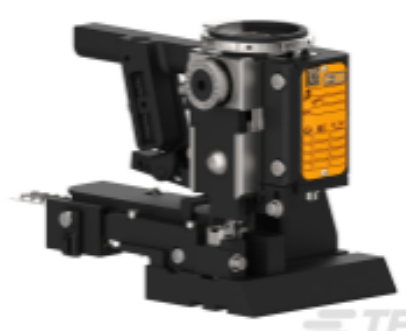
TE 产品编号2-2266253-1 OCEAN_2.0_Applicator-S-090F165O