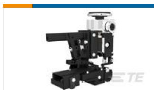
TE 产品编号2-2151240-1 OCEAN_2.0_APPLICATOR-S-055F075F