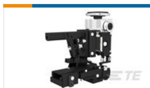
TE 产品编号2-2151307-1 OCEAN_2.0_APPLICATOR-S-042F062O