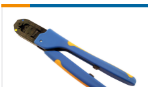
TE 产品编号234604-1 SAHT 2.5 SIG DBL-L M REC TAB 26-22 ASSY