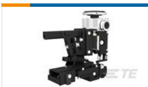
TE 产品编号2-2266289-1 OCEAN_2.0_Applicator-S-110F140F