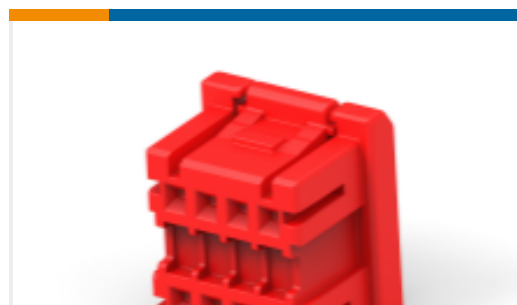
TE 产品编号1-2315883-2 GIC2.5W PLUG HOUSING 8POS (2-ROW) RED