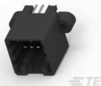
TE 产品编号2098401-2 040 MLC CAP ASSY V 8P - HT