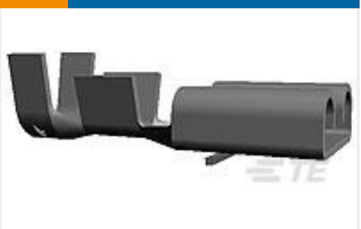
TE 产品编号5-160446-5 FF 250 REC 1.0-2.5MM2 TBBR