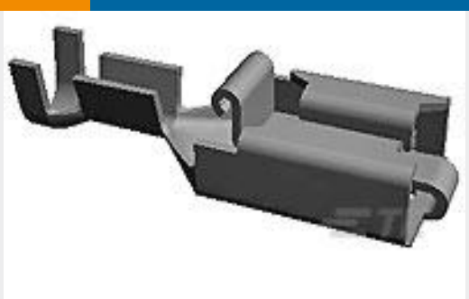
TE 产品编号160831-4 PL REC 1.0-2.5 MM2 .0160 X 2.060 TPPHBZ