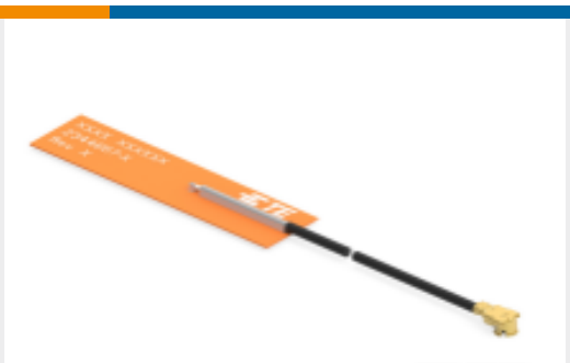
TE 产品编号2344657-8 FPC ANTENNA, CABLE, MHF, Wi-Fi TRIPLE