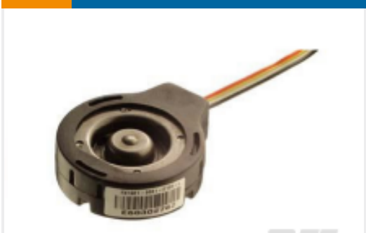
TE 产品编号FX1901-0001-0200-L 200 LBF COMPRESSION LOAD CELL 100MV