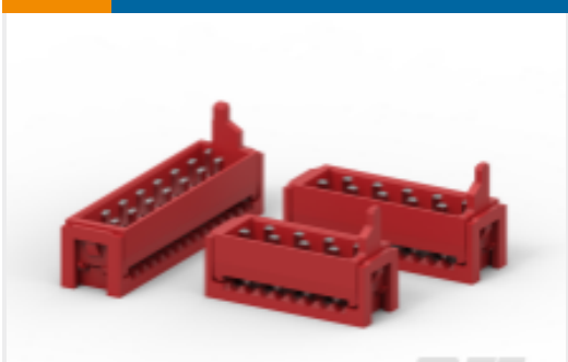
TE 产品编号2-215083-4 Male-on-Wire Connector, Micro-MaTch