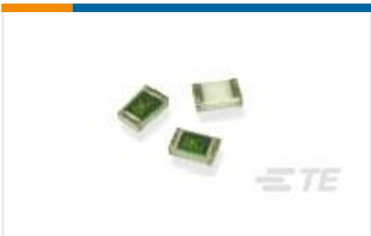
TE 产品编号1676288-2 RN 0805 2K37 0.1% 10PPM 1KRL