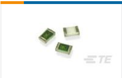
TE 产品编号1676319-2 RN 0805 38K3 0.1% 10PPM 1KRL