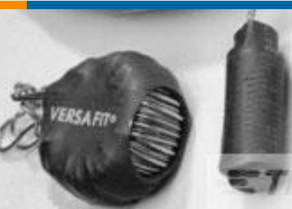
TE 产品编号CZ8200-000 VERSAFIT-3/4-0-2.25IN