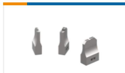
TE 产品编号1803010-7 ANVIL, SPECIAL, COMBINATION