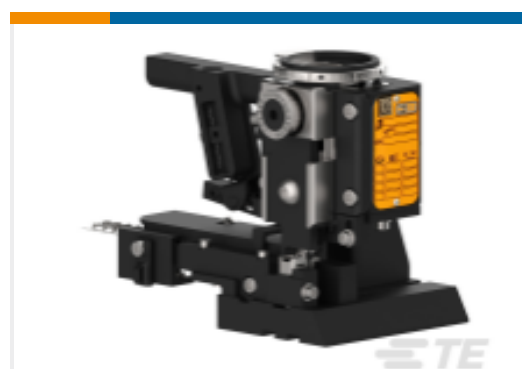
TE 产品编号2-2151169-1 OCEAN_2.0-APPLICATOR-S-070F070F