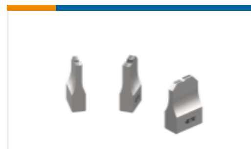
TE 产品编号4-1633917-8 ANVIL, COMBINATION