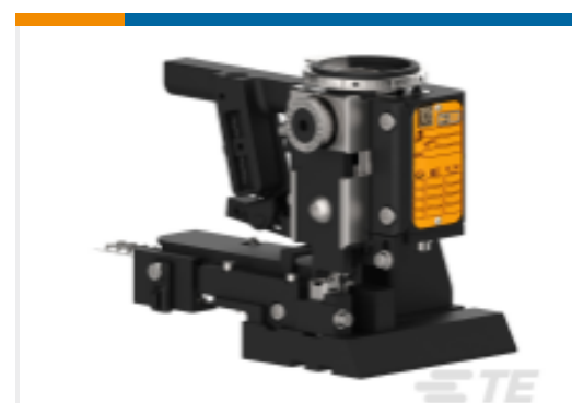
TE 产品编号2-2266892-1 OCEAN-2.0-APPLICATOR-S-080F120OV