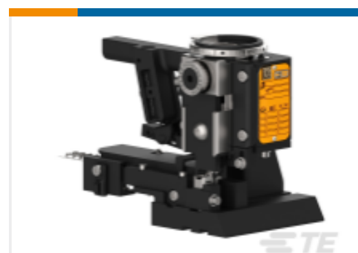
TE 产品编号2-2266893-1 OCEAN_2.0-APPLICATOR-S-070F110F