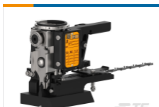
TE 产品编号2-2150171-1 OC-PA-E-FM-080F230F-059-1104