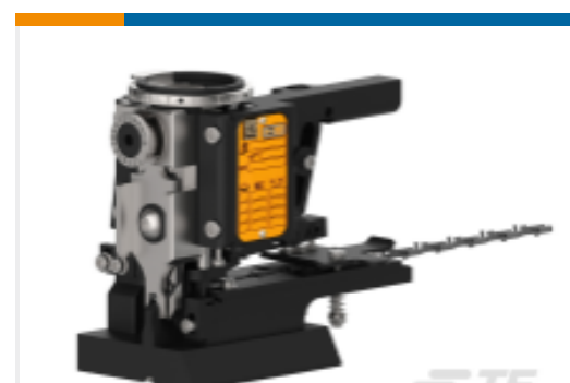
TE 产品编号2-2150606-1 OC-PA-E-FM-110F150F-115-0310