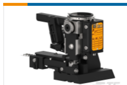
TE 产品编号2-2266916-1 OC-PA-S-FM-080F130F-059-0302