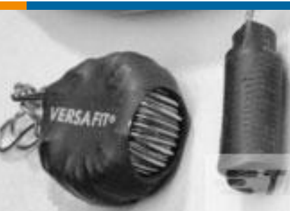
TE 产品编号CZ8200-000 VERSAFIT-3/4-0-2.25IN