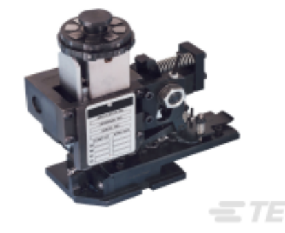
TE 产品编号680588-3 HDM 9HBAPR140S140OG