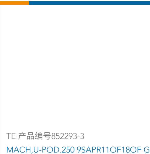
TE 产品编号852293-3 MACH,U-POD.250 9SAPR11OF18OF G