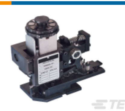
TE 产品编号680588-3 HDM 9HBAPR14051400G