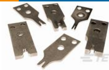
TE 产品编号6-456134-7 CRIMPER, INSULATION "F"(.210")