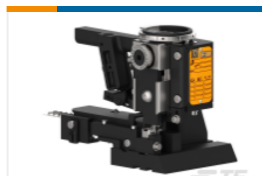
TE 产品编号2-2266941-1 OCEAN-2.0-APPLICATOR-S-063F079D