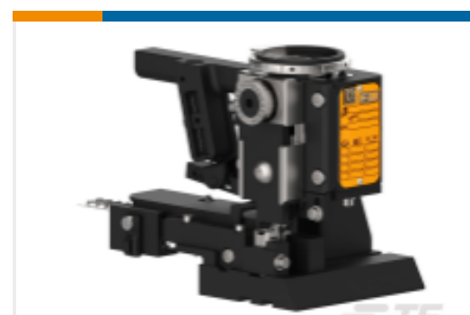
TE 产品编号2-2266925-1 OCEAN_2.0_APPLICATOR-S-070F100F