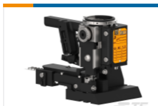
TE 产品编号2-2266543-1 OCEAN_2.0_APPLICATOR-S-062F114O