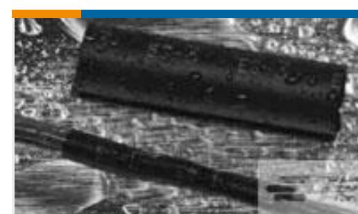
TE 产品编号121397P013 ES2000-NO.3-B8-0-41MM