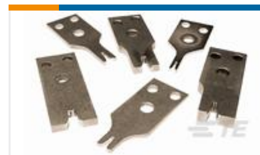
TE 产品编号6-456134-7 CRIMPER, INSULATION "F"(.210")