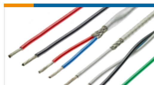
TE 产品编号D81041-000 44B1831-22-MST3-9CS2275