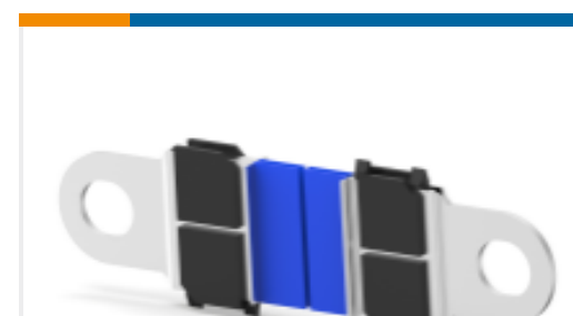
TE 产品编号766488-1 CABLE ASSY, AMPPOWER WAVE CRIMP