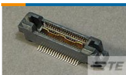
TE 产品编号767118-1 MICT,PLG,038,ASY,,025,TAPE CAP