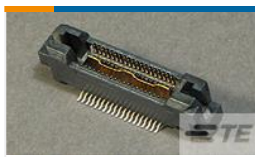
TE 产品编号767118-1 MICT,PLG,038,ASY,.025,TAPE CAP