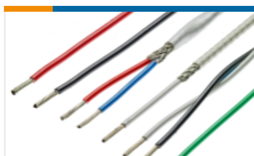
TE 产品编号D81041-000 44B1831-22-MST3-9CS2275