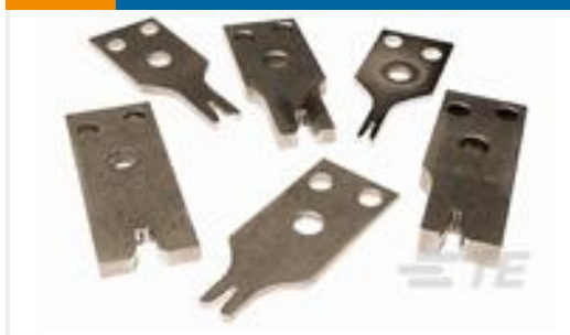
TE 产品编号3-1891946-5 WIRE CRIMPER, SIDE FEED