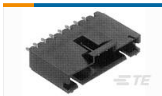
TE 产品编号5-103669-3 04 MTE HDR SRST LATCH W/HLDWN