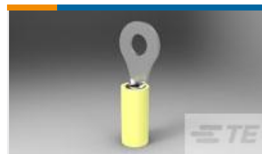
TE 产品编号323915 TERMINAL,PIDG R 26-22 6