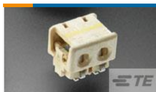
TE 产品编号2-2106431-1 Connector, SMT-IDC PASS THRU, 1 POS, 22