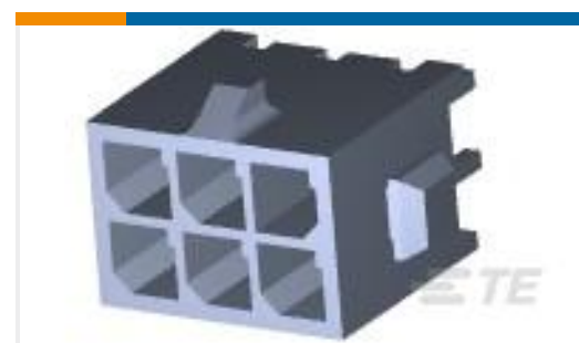
TE 产品编号3-794631-6 06P MICRO MNL ASSY,VRT,HDR LF