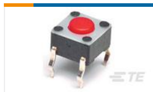
TE 产品编号1825910-3 FSM2JAH=6MM TACT SWITCH, HIGH TEMP