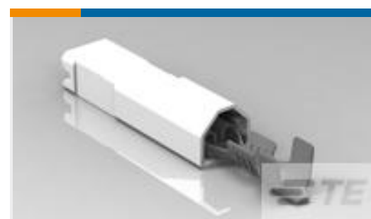
TE 产品编号521408-2 ULTRA-POD 110 ASSY REC 22-18 AWG TPBR