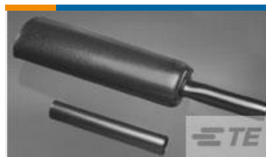
TE 产品编号934922-000 RMW-75/22-1200/ADH-0