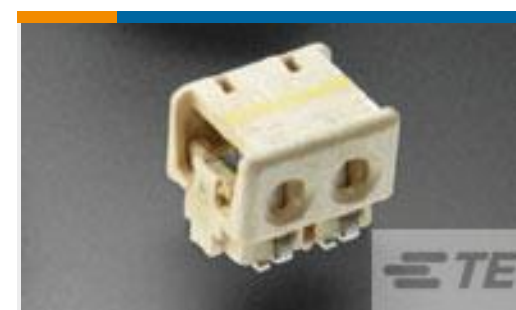
TE 产品编号2-2106003-1 Connector, SMT-IDC, 1 POS, 22 AWG